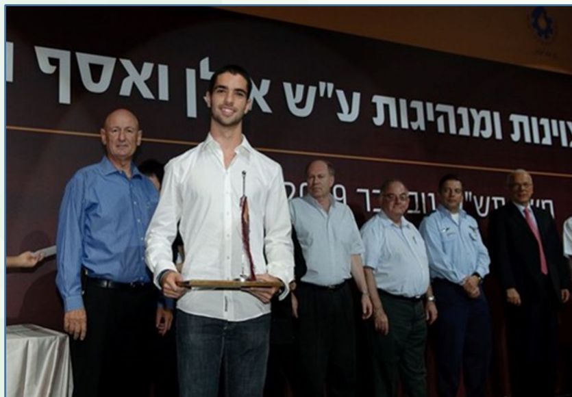
מצטיין אות רמון