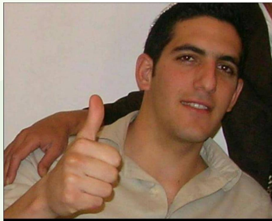
מתכון עם זיכרון